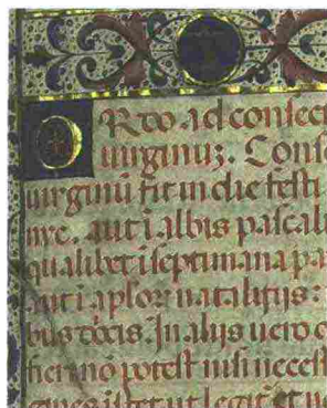
Processionale per la consecrazione delle monache (1450/1480); in alto il pavimento della mostra; Rotolo Trivulzio (1777) e Codice di Sturioni

le Alemagna 6 alcuni detenuti incontrano Daria Bignardi. Per contro, un braccio di San Vittore ospita opere d'arte della Fondazione Maimeri e la Rotonda di piazza Filangieri 2 apre le porte alla città, l'11 e il 18, per discutere di delitti e di pene, violenza e giustizia riparativa con Gherardo Colombo, Piercamillo Davigo, Marta Cartabia e Adolfo Ceretti. Triennale, ingresso libero ore 10,30-20,30, per San Vittore registrarsi: info.amicidellanave@gmail.com (f.f.)